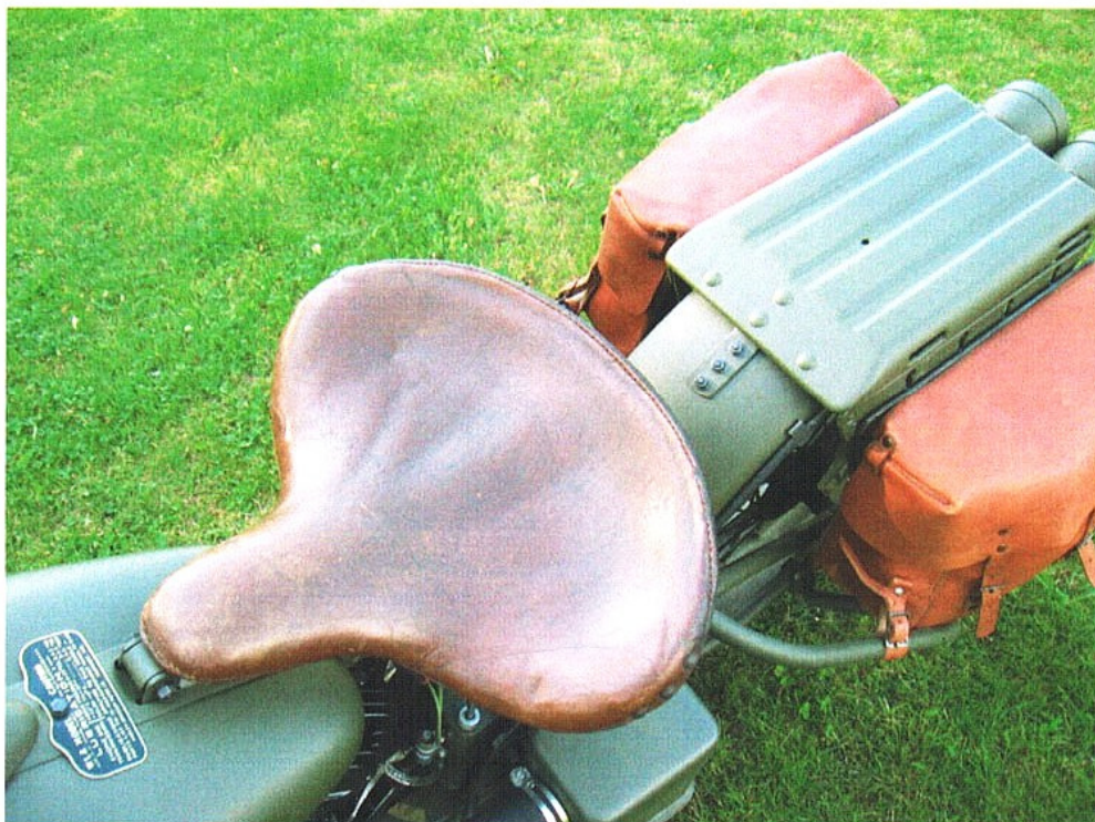
Vaade sõiduki istme(te)le