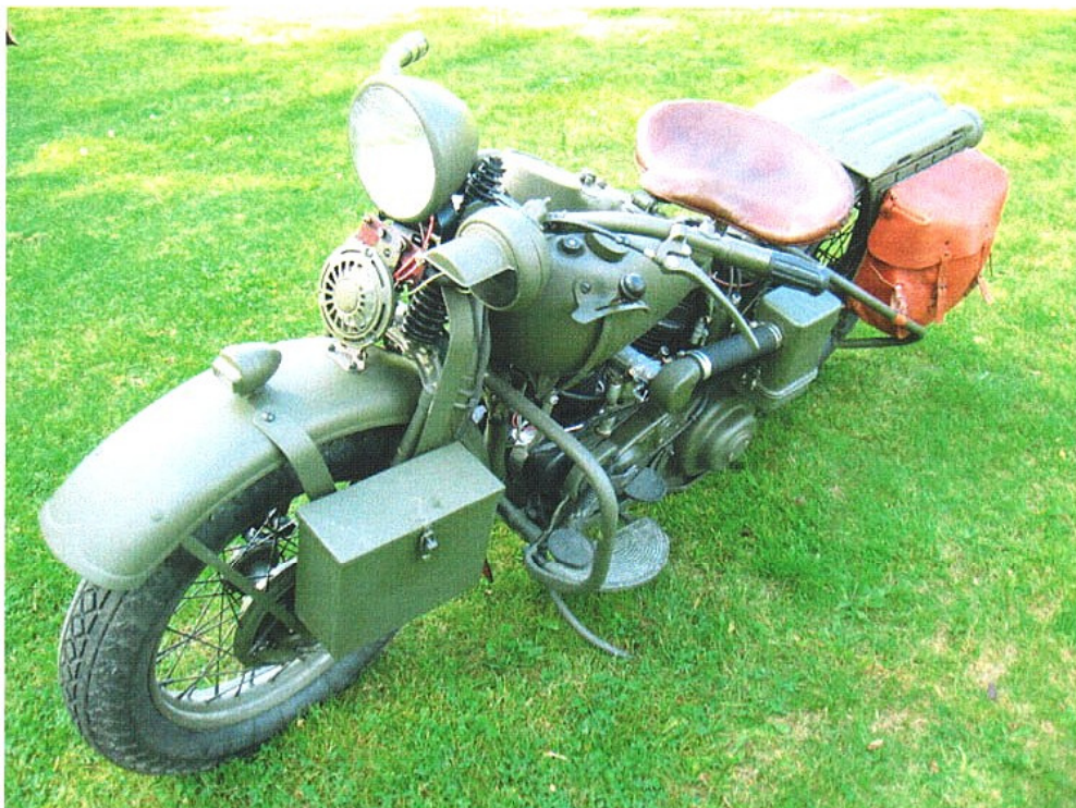
Diagonaalvaade esiosale ja vasakule küljele