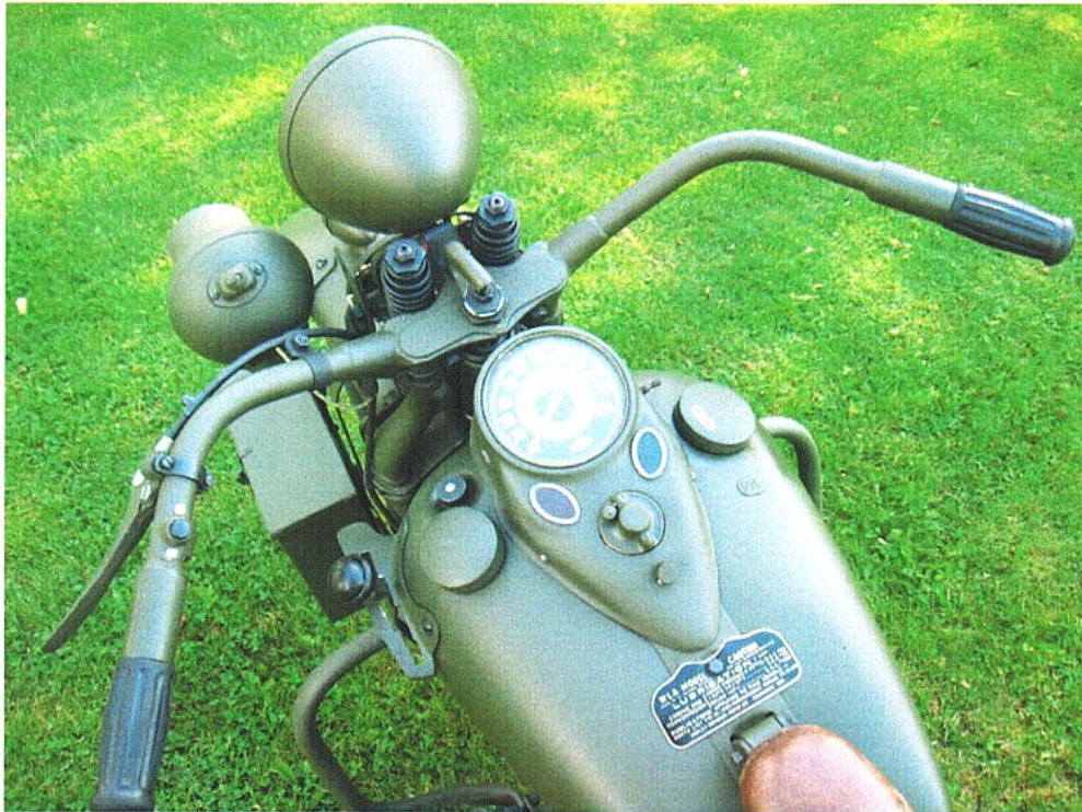
Vaade sõiduki juhtimisseadmetele