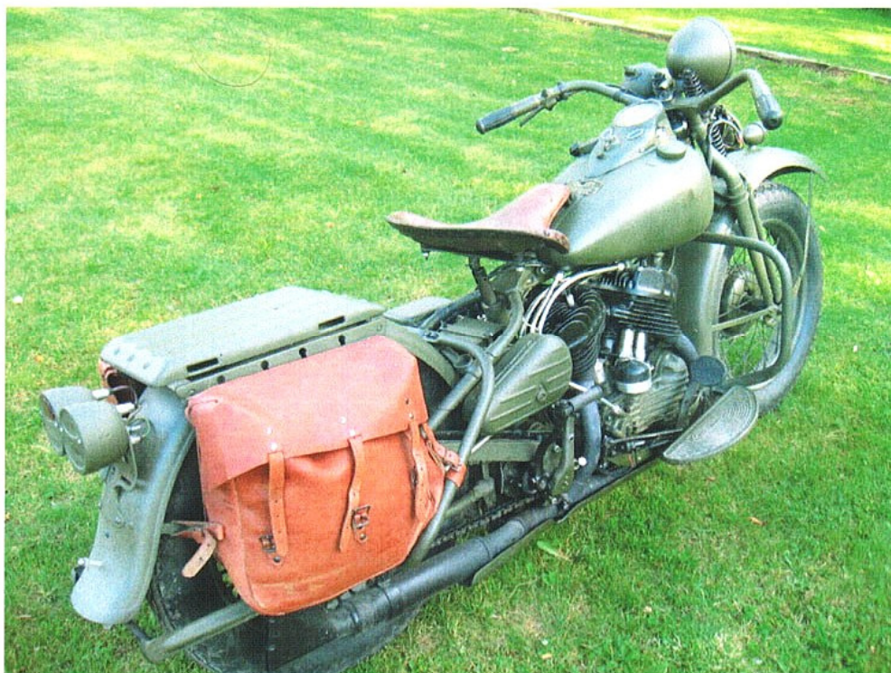
Diagonaalvaade tagaosale ja paremale küljele